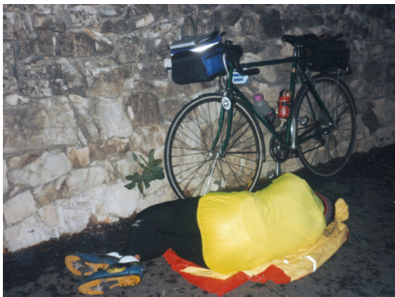
... contre un mur, pour essayer de dormir un peu...

Nous signons et postons une carte, témoin de notre passage et nous nous planquons à l'abri d'un mur pour grignoter quelques provisions et essayer de dormir un peu.