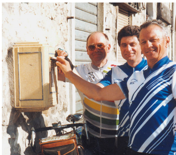
Tout sourire pour poster la carte "Arrivée"