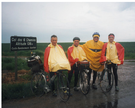
Au col des 6 chemins, sous la pluie...

passage à L'Ecluse restera pour nous l'un des moments très forts de cette Diagonale.