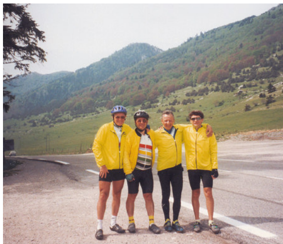
Au sommet de la Croix-Haute