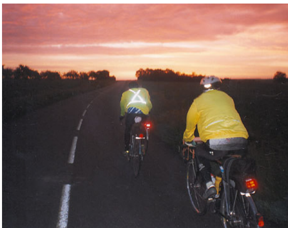
Lever du jour en Loir-et-Cher