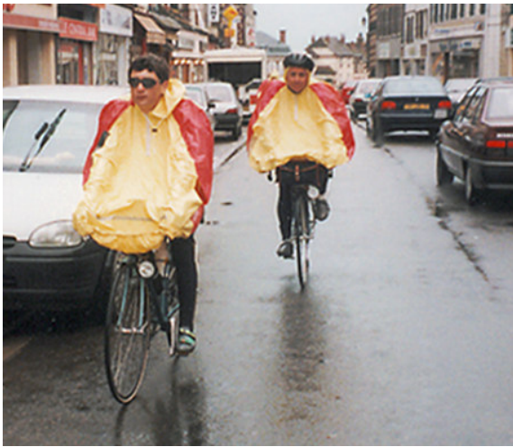
Pluie à Châteauneuf-en-Thimerais...